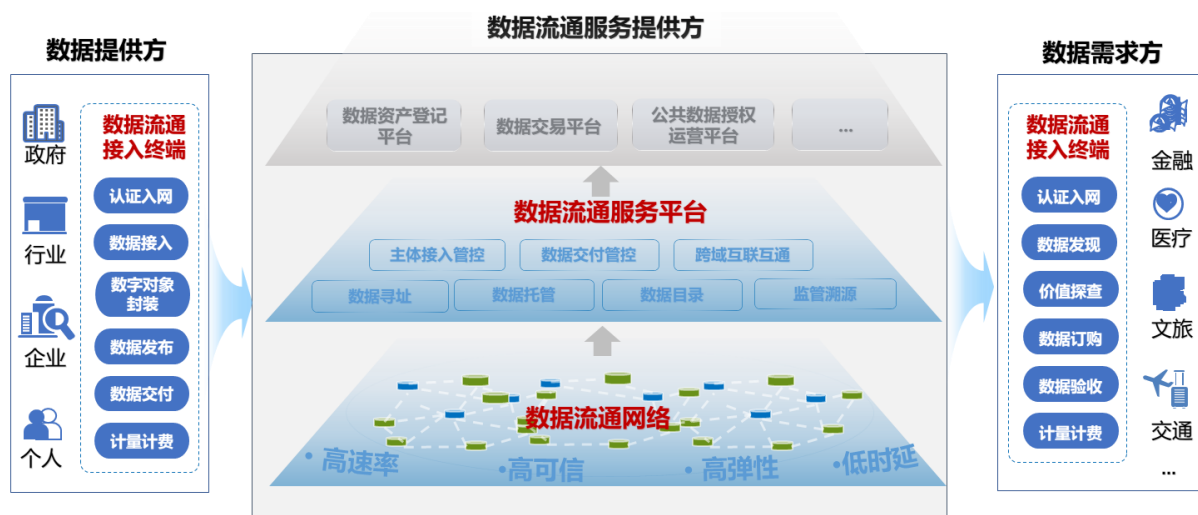
图 4 数联网功能架构图

数联网由数据流通接入终端、数据流通网络、数据流通服务平台构成，提供一点接入、广泛连接、标准交付、安全可信、合规监管、开放兼容的数据流通服务。