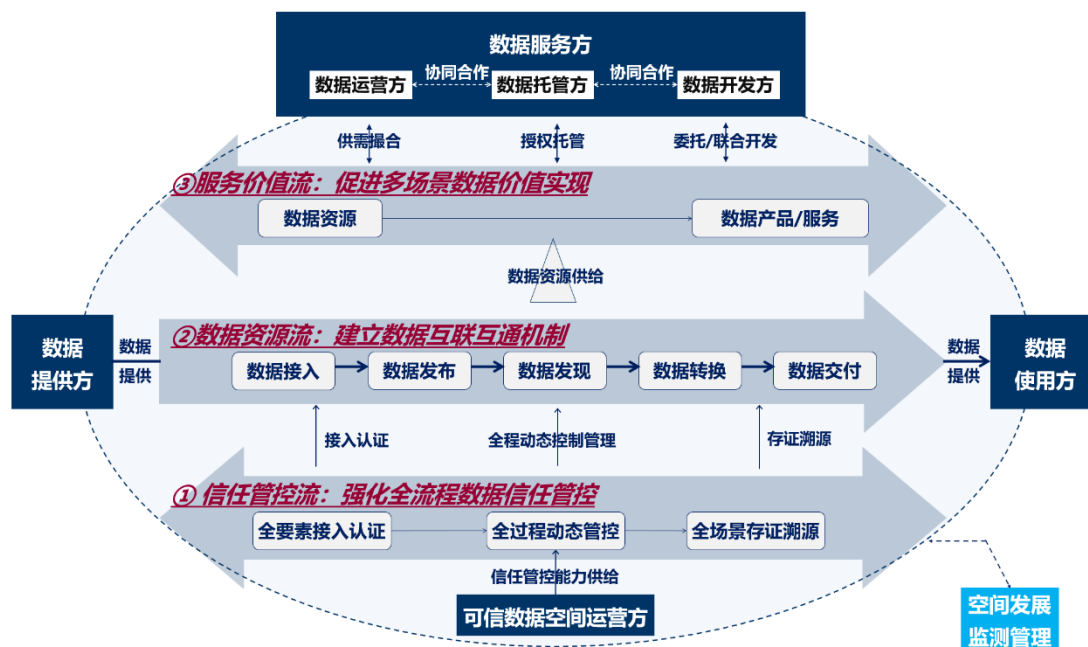
图 2 可信数据空间架构图

可信数据空间是基于共识规则，联接多方主体，实现数据资源共享共用的一种数据流通利用设施，是数据要素价值共创的应用生态，是支撑构建全国一体化数据市场的重要载体。可信数据空间须具备数据可信管控、资源交互、价值共创三类核心能力。